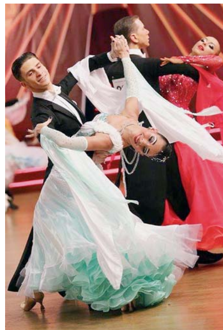
Балльно-спортивные танцы развивают чувство ритма и заставляют двигаться пластично

С другой стороны, вовсе не обязательно заниматься танцами ради высоких достижений. Можно попробовать спорт «для себя». Хорошая музыка, приятная атмосфера и красивые движения не только поднимут настроение, но и заставят с не-